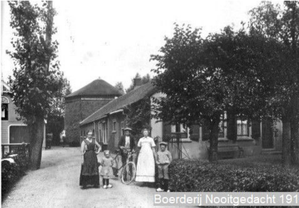
Boerderij Nooitgedacht 1916