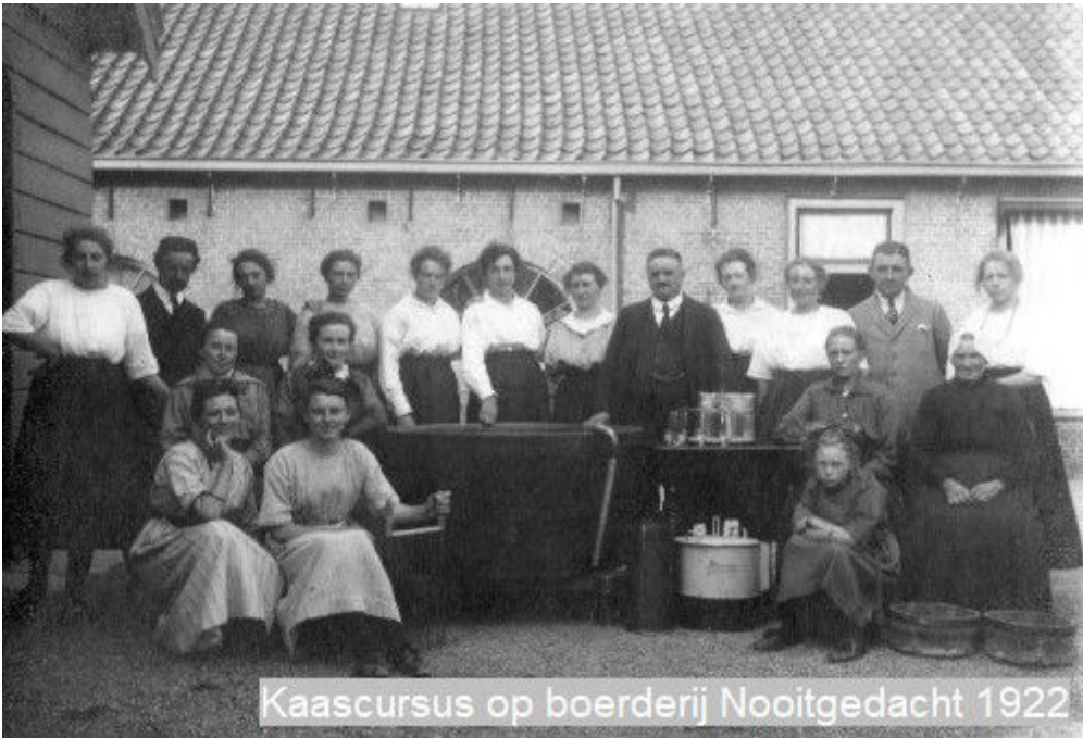
Kaascursus op boerderij Nooitgedacht 1922