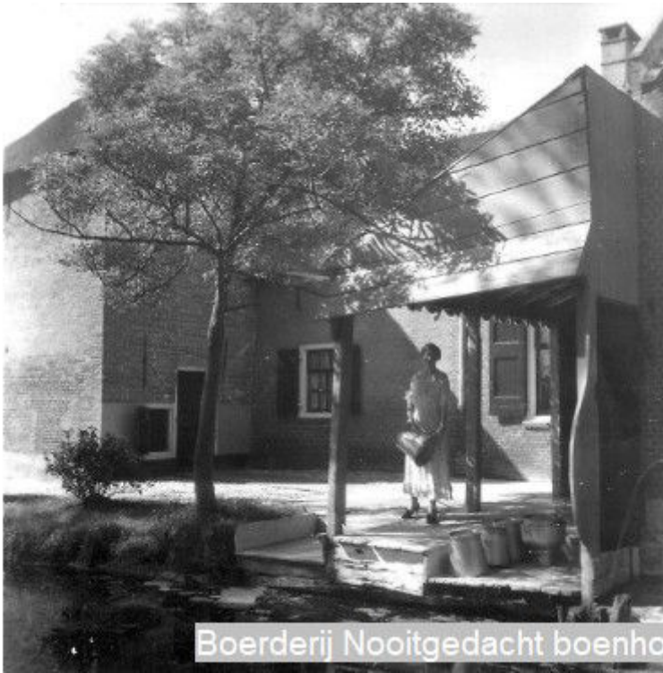
Boerderij Nooitgedacht boenhok 1940